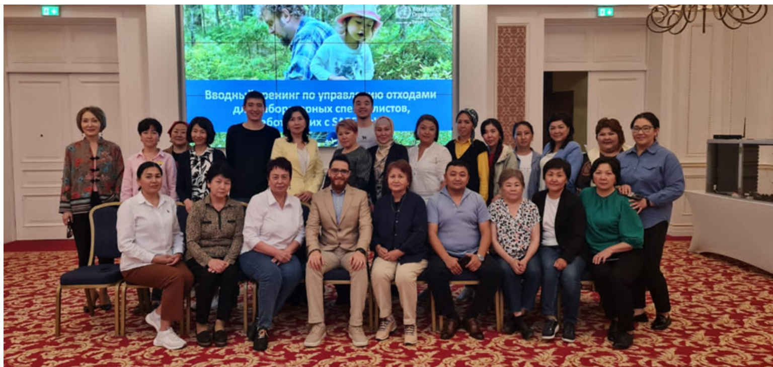
Тренинг по управлению медицинскими отходами в г. Бишкек, 12-13 мая 2022 года, г. Бишкек, Кыргызская Республика

С 12 по 13 мая 2022 г. ВОЗ провела тренинг по управлению медицинскими отходами для 21 участника. Тренинг был сосредоточен на стратегиях управления отходами и передовой практике в медицинских учреждениях для создания более безопасной среды и минимизации рисков в лабораториях. Участники продемонстрировали повышение уровня знаний на 13.5%, средний результат пре-теста составил 49.5%, а пост-теста увеличился до 63%. Тренинг был частью комплексного подхода к усилению мер биобезопасности в лабораториях.