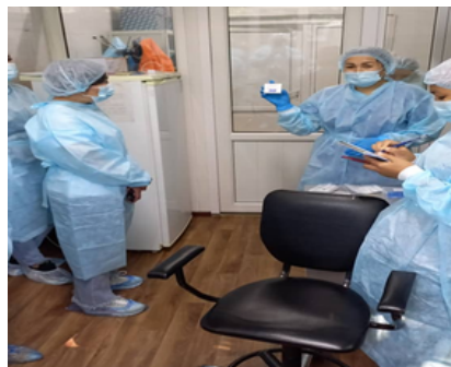
Тренинг по использованию мультиплексного теста методом ПЦР на грипп и SARS-CoV-2 в ДПЗиГСЭН, г. Бишкек, 6- 9 июня, 2022 г.