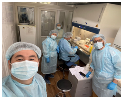
Верификация мультиплексного анализа ПЦР на грипп и SARS-CoV-2 в ДПЗиГСЭН, г.Бишкек, май, 2022 г.

В течение второй недели мая эксперты ВОЗ оказали поддержку национальным экспертам Департамента профилактики заболеваний и государственного санитарно-эпидемиологического надзора (ДПЗиГСЭН) по верификации мультиплексного ПЦР-теста на SARS-CoV-2 и грипп в рамках Исследования эффективности вакцины в Кыргызской Республике, с целью возможности обнаружения любого из вирусов за счет проведения одного теста. Команда подготовила набор презентаций и разработала Программы обучения для двух тренингов, которые были проведены национальными экспертами для врачей - лаборантов лабораторий всей страны с 6 по 9 июня 2022 года. Тренинги полностью проводились силами национальных экспертов из Департамента ПЗиГСЭН в рамках поддержки национального потенциала в плане наращивания потенциала и подготовки национальных тренеров