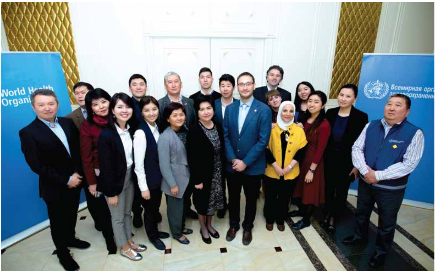
Кыргызстандагы ДССУ өлкөлүк кеңсесинин командасы, 2018-жылдын апрель айы

ДССУ Өкүлү жана ДССУнун Кыргызстандагы кеңсесинин Жетекчиси