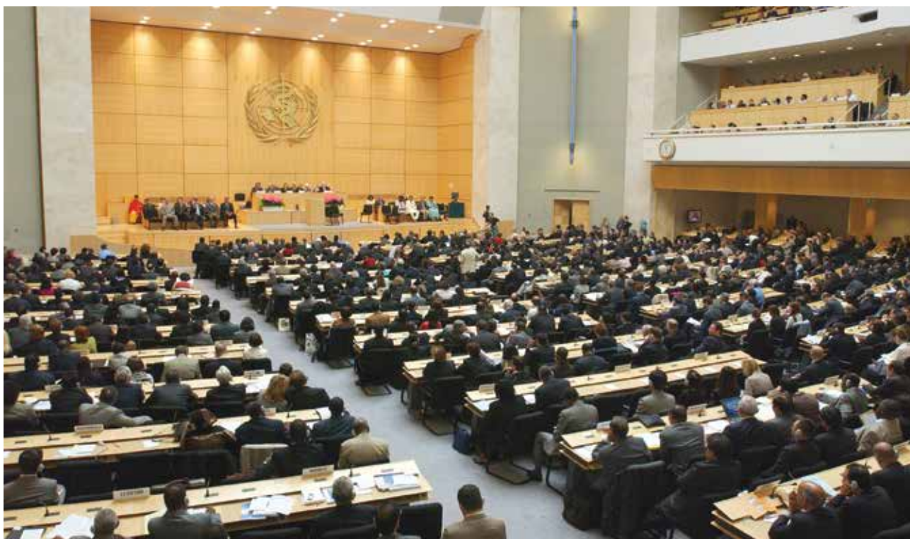
Саламаттык сактоонун Дүйнөлүк ассамблеясы, 2017-ж.

Доктор Тедрос Адханом Гебрейесус, ДССУ Башкы директору