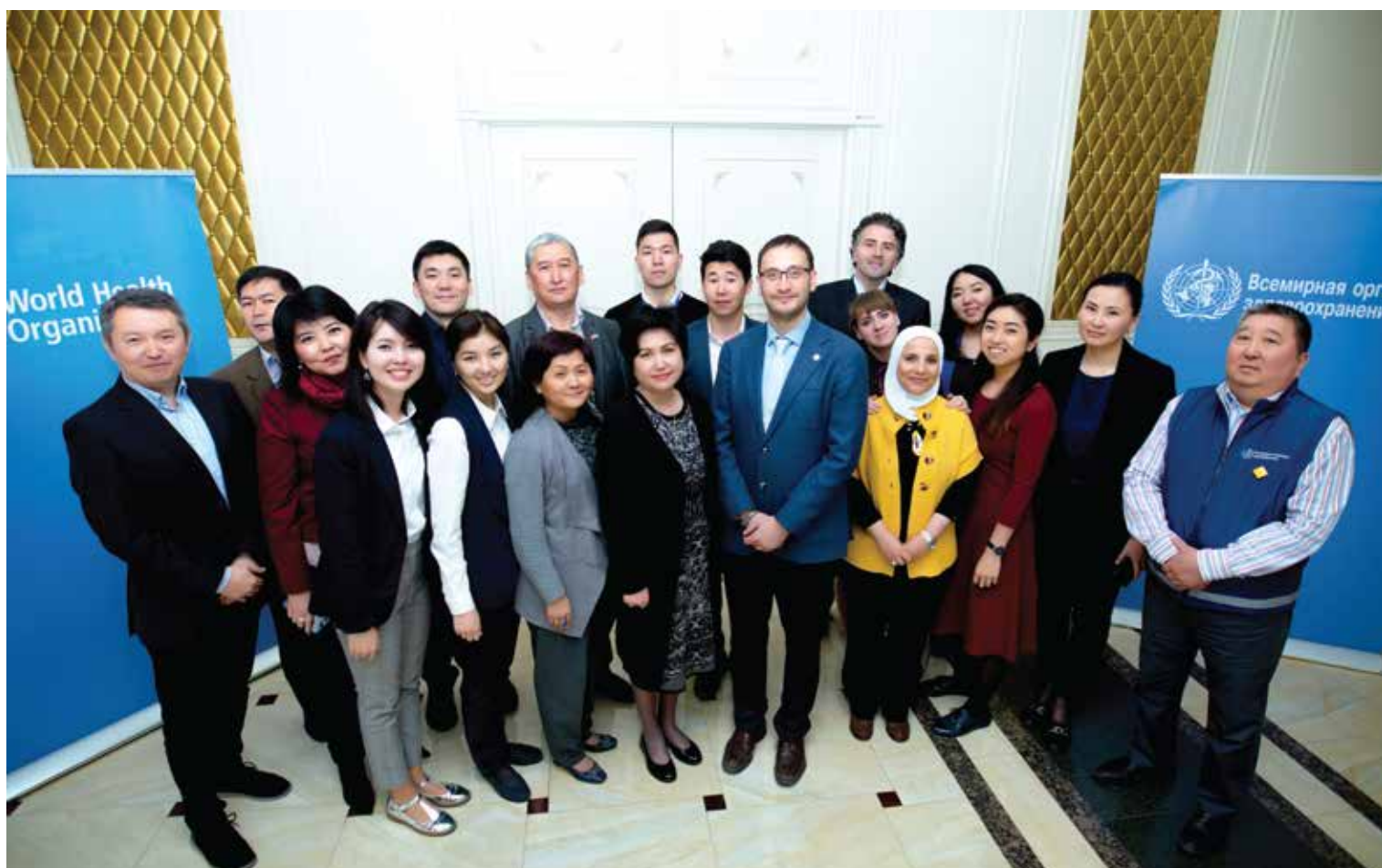
Команда странового офиса ВОЗ в Кыргызстане, апрель 2018 года