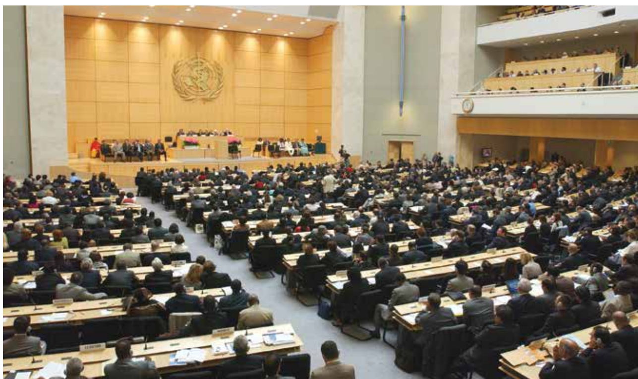
Всемирная ассамблея здравоохранения 2017 г.

Доктор Тедрос Адханом Гебрейесус, Генеральный директор ВОЗ