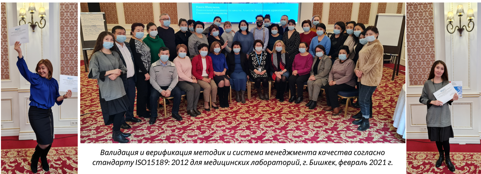
Валидация и верификация методик и система менеджмента качества согласно стандарту ISO15189: 2012 для медицинских лабораторий, г. Бишкек, февраль 2021 г.

Второй тренинг по требованиям системы менеджмента качества для медицинских лабораторий согласно ISO15189: 2012, прошедший с 16 по 18 февраля, показал улучшение знаний на 16%: результаты пре-теста составили 68%, а результаты пост-теста выросли до 84%. Тренинги были проведены д-ром Ренатой Сзыпульской, консультантом Европейского регионального бюро ВОЗ.