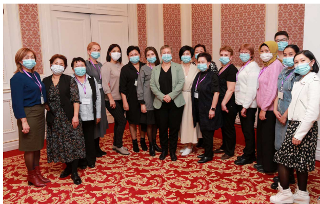
Тренинг по повышению квалификации по вопросам системы менеджмента качества (СМК), г. Бишкек, октябрь 2021 г.