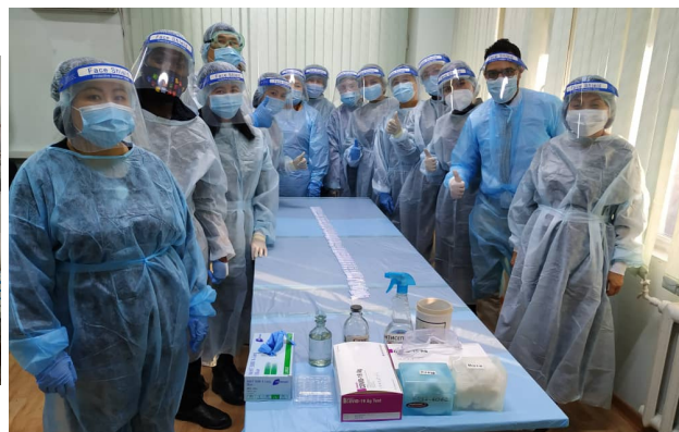
Тренинг по экспресс-тестированию на наличие антигена SARS-CoV-2, г. Бишкек, январь 2021 г.