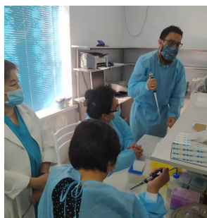
Тренинг по ПЦР на SARS-CoV-2, г. Бишкек, октябрь 2021 г.