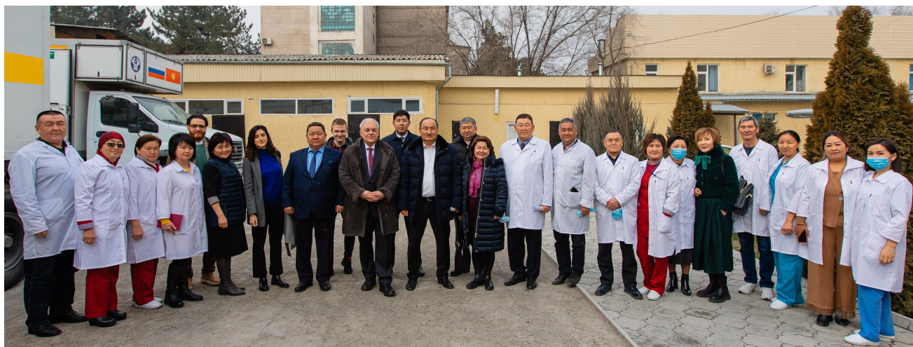
Совместный визит ВОЗ, посла ЕС и Министерства здравоохранения КР в Республиканский центр карантинных и особо опасных инфекций (РЦКиООИ), г. Бишкек, февраль 2022 г.

Визит состоялся в рамках «Программы реагирования на кризисную ситуацию в связи с COVID-19 в Центральной Азии» (англ. «Central Asia COVID-19 Crisis Response Programme (CACCR)»), которая является совместным начинанием Европейского союза и Европейского регионального бюро ВОЗ, нацеленным на содействие предупреждению, выявлению и реагированию на пандемию, а также усилению потенциала стран для реагирования на аналогичные угрозы в области общественного здравоохранения. Визит предназначен отметить поддержку, оказываемую лаборатории, результатом которой стало успешное прохождение аккредитации по стандарту ISO15189: 2012 в августе 2021 года.