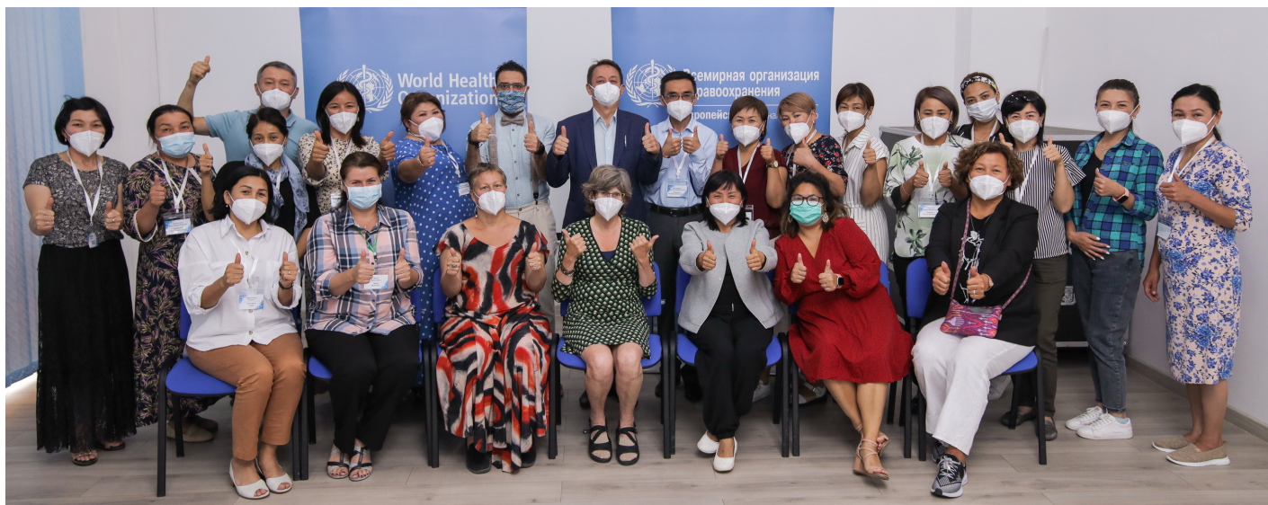
Первый национальный диалог, проведённый ВОЗ для лабораторных специалистов, работающих в области SARS-CoV-2, на озере Иссык-Куль, Кыргызская Республика, в августе 2021 года.