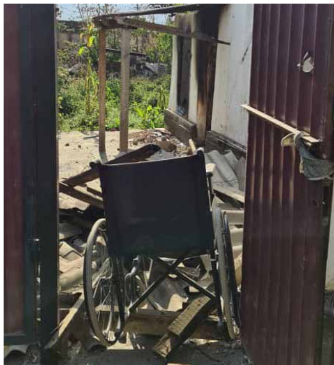
Разрушенный дом в селе Капчыгай Баткенской области. Фото с визита дипломатического корпуса 22 сентября 2022 г.

Всем категориям детей в пострадавших районах (ВПЛ и возвращенцам) будет оказана первая психологическая помощь с помощью центров дружественного отношения к детям (ЦДОСДО). Создание ЦДОСДО является основной базой для предоставления психосоциальной поддержки (ППС) детям в пострадавших сообществах. Преимуществом ЦДОСДО является их близкое расположение к местам проживания детей, что создает ощущение безопасной обстановки.