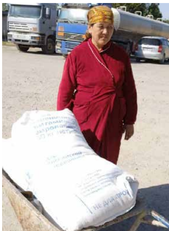
Продовольственная помощь ВПЛ ООН в Баткене.

Денежная помощь является предпочтительным способом для ВПЛ и наиболее уязвимых принимающих сообществ, которые не имеют достаточного дохода, сбережений и/или возможностей для получения средств к существованию, и где рынки функционируют в Баткенской и Ошской областях. Денежные средства будут доставляться через поставщиков финансовых услуг или партнеров ГКРЧС, используя при необходимости существующие национальные механизмы проверки соответствия критериям и дедупликации, с учетом различных механизмов перевода, таких как наличные в конверте, платежные карты и мобильные деньги, для ускорения получения денежной помощи и помочь тем людям, которые находятся вдали от банковских отделений.