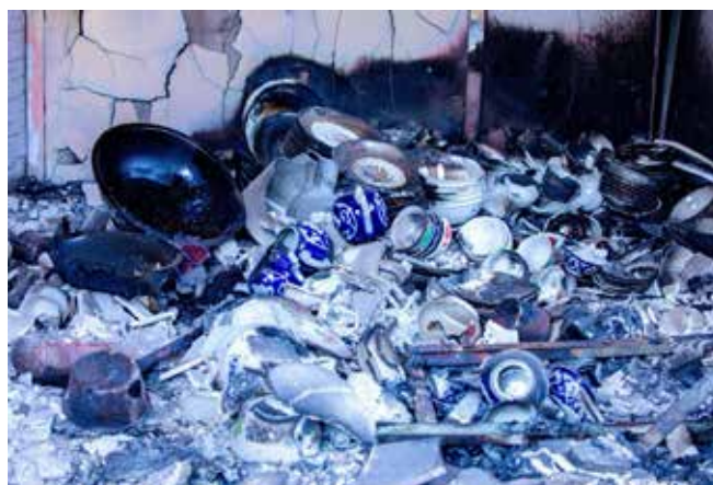
Разрушенный дом в селе Торт-Кочо Баткенской области.