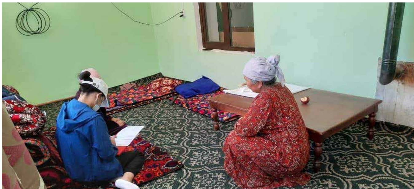
КИАНА межучрежденческая оценка потребностей

Межведомственная оценка потребностей Кыргызстана (KIANA) показала, что в связи с эскалацией насилия во всех пострадавших районах имеются неотложные гуманитарные потребности, такие как обеспечение продовольствием и НПТ, жильем, надлежащими средствами санитарии и гигиены, распределение предметов гигиены и предоставление теплой одежды в преддверии предстоящего зимнего сезона, доступ к медицинским учреждениям, а также психологическая поддержка и необходимость в юридической помощи для восстановления личных, идентификационных и имущественных документов, утерянных во время перемещения. По оценкам, в гуманитарной помощи нуждаются 146 228 человек (НЛ) в трех пострадавших районах южных регионов страны. Из них План реагирования направлен на охват более 77 700 человек, считающихся наиболее уязвимыми, для удовлетворения потребностей которых требуется гуманитарное финансирование в размере 14,7 миллионов долларов.